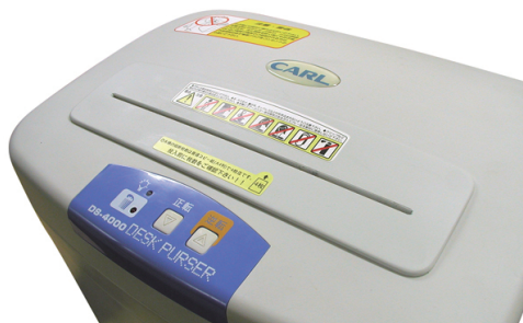
斜めから見た写真